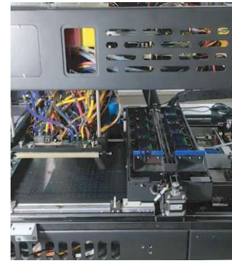
Sistema de suministro de tinta avanzado y flexible