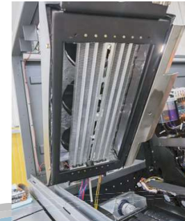
Sistema de secado por radiación térmica infrarroja