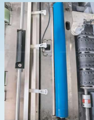
Alimentación de papel por succión neumática + detección ultrasónica de doble hoja y descarte de residuos